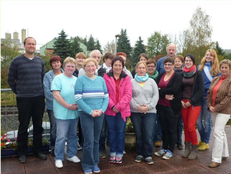
Teilnehmer des erster Lehrgangs Automatische Melksysteme in Stadtroda