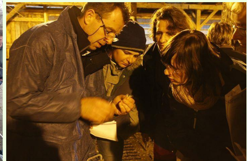
Nutztierforum: Kuhsignale erkennen und verstehen in Wenigenauma und Bad Berka