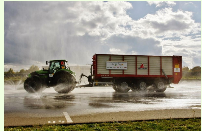
Fahrsicherheitstraining für Traktoristen in Nohra