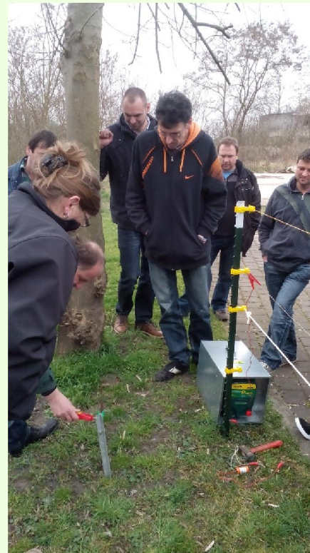
Seminar Weidesicherheit →